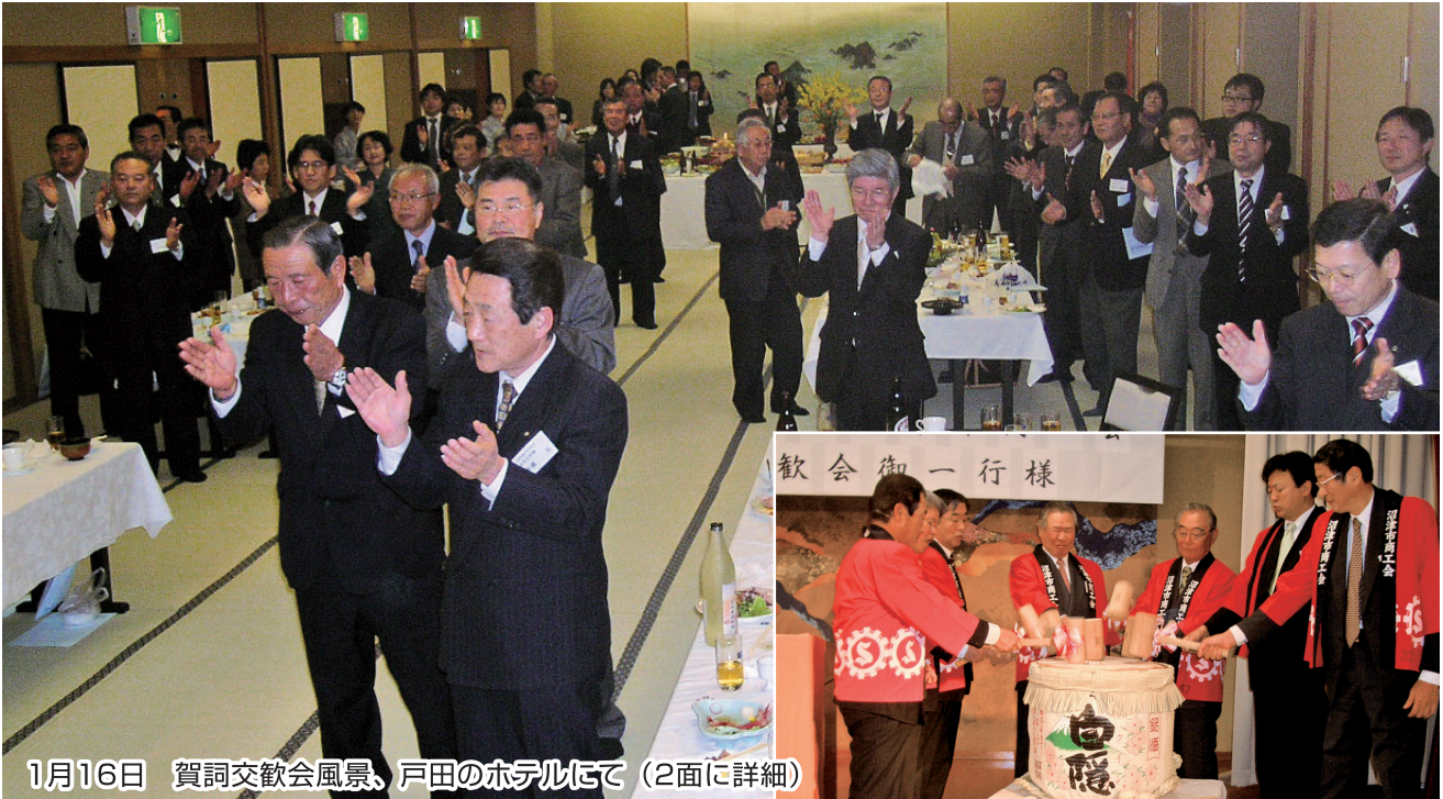
1月16日 賀詞交歓会風景、戸田のホテルにて (2面に詳細)

No. 11 発行者 沼津市商工会 会長 松永公良 〈本所・原支所〉沼津市原1200番地の1 TEL (055) 966-1331 FAX (055) 967-4925 〈戸田支所〉沼津市戸田1028番地の5 TEL (0558) 94-2224 FAX (0558) 94-4029 編集 沼津市商工会広報委員会